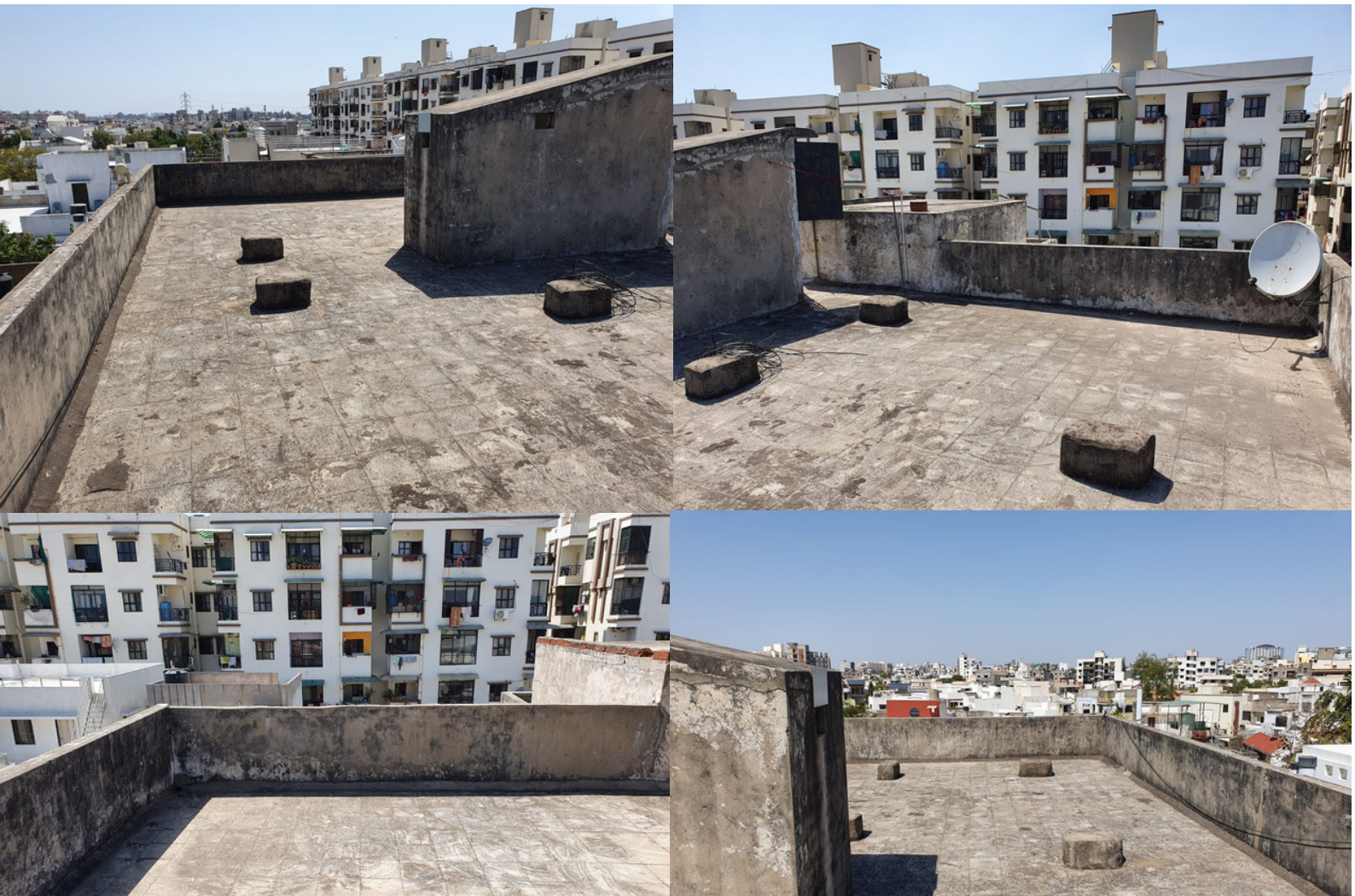
Personal Terrace For Sloar & Other Use