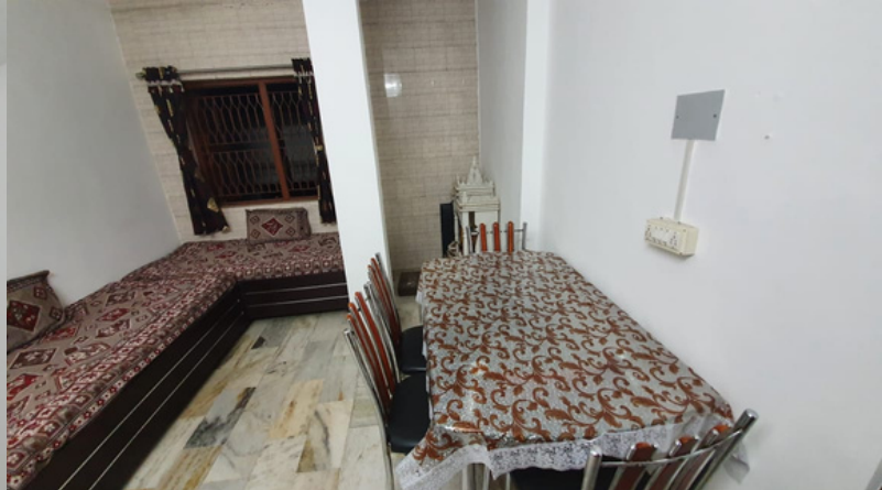
Hall Cum BedRoom