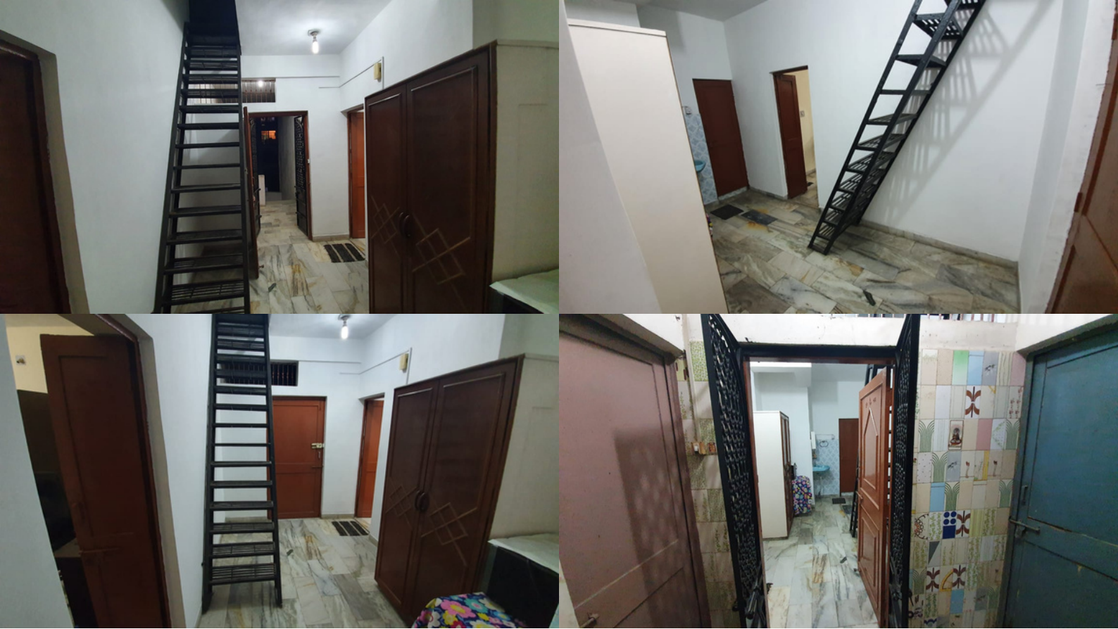
Veranda Room + Entry